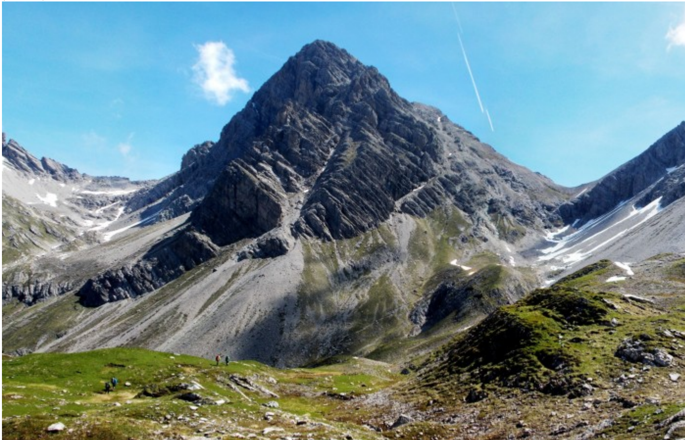
Der große Krottenkopf von Süden aus betrachtet. Rechts davon die Krottenkopfscharte und darunter der Aufstiegsfad.

Der Aufstieg zur Scharte war steil und wurde zum Ende hin etwas weglos, aber immer noch sehr mit vielen roten Punkten markiert. Nach Erreichen der Krottenkopfscharte haben wir uns dann den –kleinen- Gipfelanstieg gespart. Aufgrund der Wetterprognose eine gute