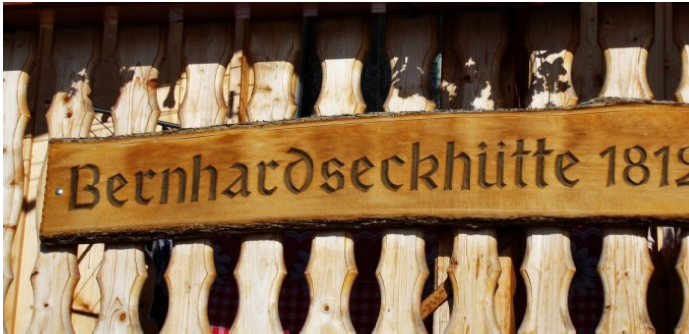
Die Bernhardseckhütte auf 1812 m Höhe über Elbigenalp im Lechtal.