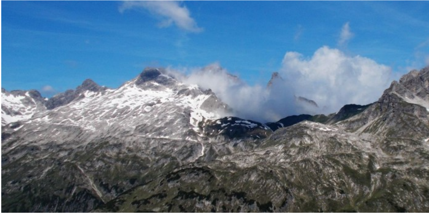
Die Ostseite von Mädelegabel (links) und Trettachspitze (in den Wolken), im Vordergrund (rechts) der Kratzer.